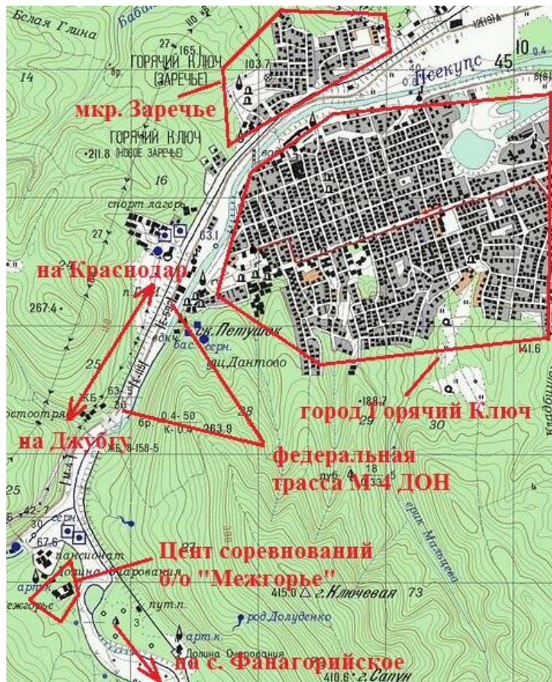
Схема Центра соревнований