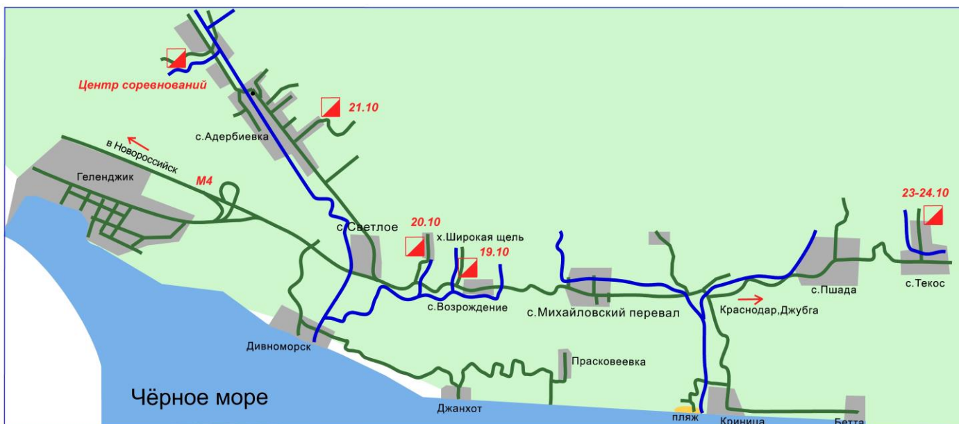
Схема проезда "Золотая Осень - 2021"