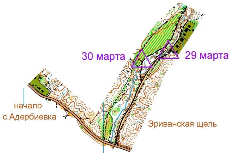
Схема тренировочного полигона 29-30 марта